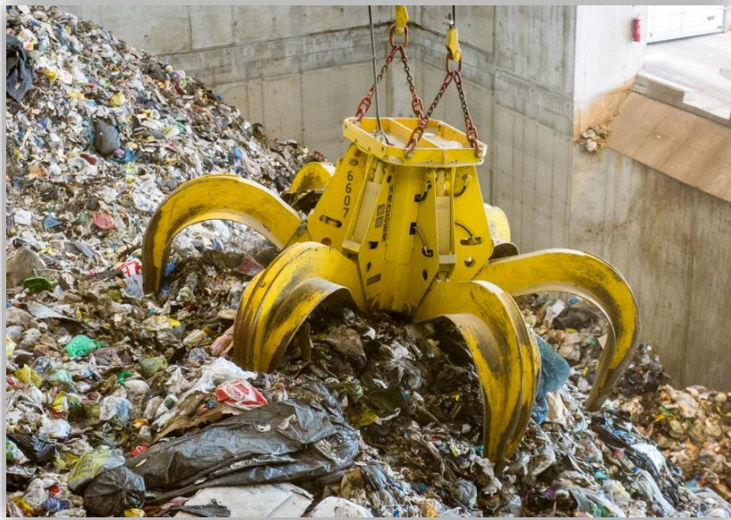
Kuva 2. Jätettä jätebunkkeriin syöttävä kahmari.

Jäte varastoidaan polttolaitoksella vastaanottobunkkeriin, jossa on tarkoitukseen soveltuva, kestävä pohjarakenne. Bunkkeriin vastaanotettu jäte murskataan tarvittaessa ennen syöttöä polttoon. Yleensä laitokselle saapuva syntypaikkalajiteltu jäte on polttokelpoista sellaisenaan. Jäte nostetaan siltanosturilla ns. kahmarilla (kuva 2) syöttösuppilon kautta poltettavaksi kattilan mekaaniselle arinalle.